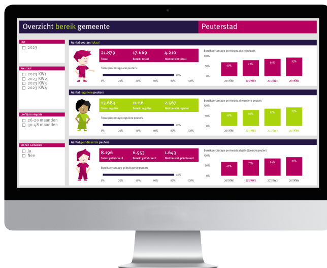
Voorbeeld van de Peutermonitor met fictieve gegevens.

De Peutermonitormonitor biedt u in één monitor een totaalbeeld met interactieve dashboards. Wij zorgen ervoor dat u extra inzichten ontvangt die van toegevoegde waarde zijn bij uw beleidskeuzes.